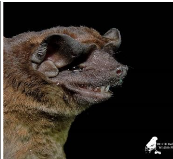
6 Molossus molossus (Insectívoro) Familia: Molossidae