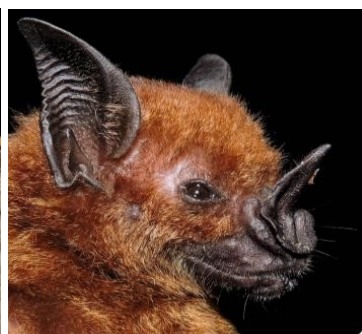
35 Phyllostomus hastatus (Insectívoro) Familia: Phyllostomidae