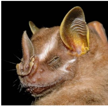
37 Platyrrhinus helleri (Frugívoro) Familia: Phyllostomidae

[fieldguides.fieldmuseum.org] [1006] versión 1 5/2018