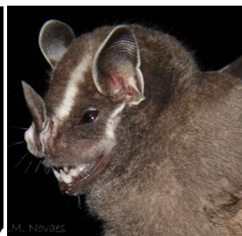
36 Platyrrhinus brachycephalus (Frugívoro) Familia: Phyllostomidae