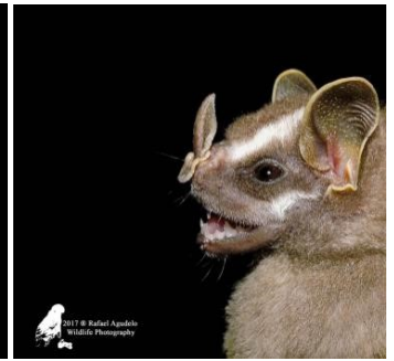
44 Uroderma bilobatum (Frugívoro) Familia: Phyllostomidae