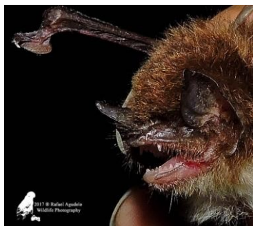
46 Thyroptera tricolor (Insectívoro) Familia: Thyropteridae