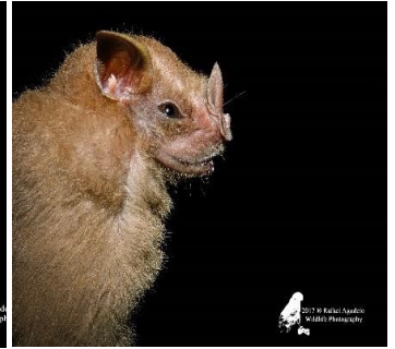
16 Chiroderma trinitatum (Frugívoro) Familia: Phyllostomidae