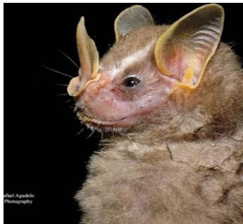
18 Dermanura glauca (Frugívoro) Familia: Phyllostomidae