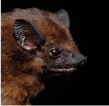
1 Cormura brevirostris (Insectívoro) Familia: Emballonuridae

[fieldguides.fieldmuseum.org] [1006] versión 1 5/2018