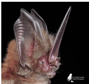
29 Lonchorhina marinkellei (Insectívoro) Familia: Phyllostomidae