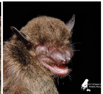
48 Eptesicus furinalis (Insectívoro) Familia: Vespertilionidae