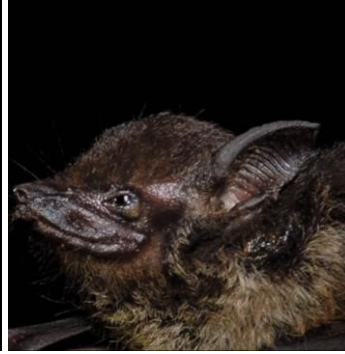
3 Saccopteryx bilineata (Insectívoro) Familia: Emballonuridae