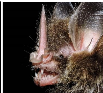
23 Gardnerycteris crenulatum (Insectívoro) Familia: Phyllostomidae