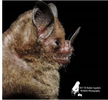
14 Carollia perspicillata (Frugívoro) Familia: Phyllostomidae