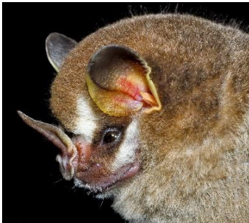
17 Dermanura cinerea (Frugívoro) Familia: Phyllostomidae