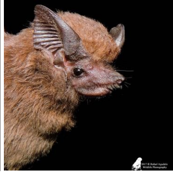
2 Peropteryx macrotis (Insectívoro) Familia: Emballonuridae