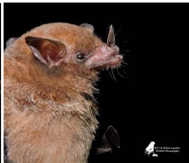
22 Hsunycteris cadenai (Nectarívoro) Familia: Phyllostomidae