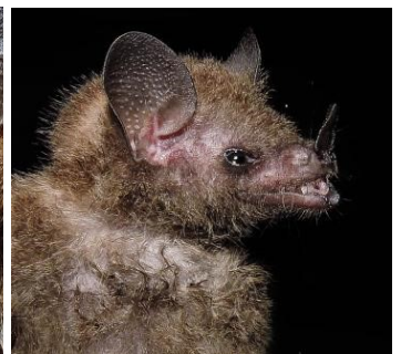
24 Glossophaga sp. (Nectarívoro) Familia: Phyllostomidae