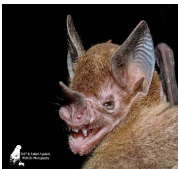
33 Phylloderma stenops (Insectívoro) Familia: Phyllostomidae