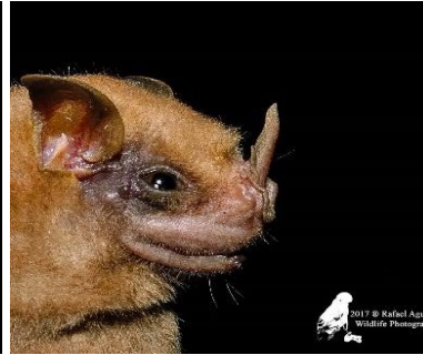
15 Chiroderma sp. 1 (Frugívoro) Familia: Phyllostomidae