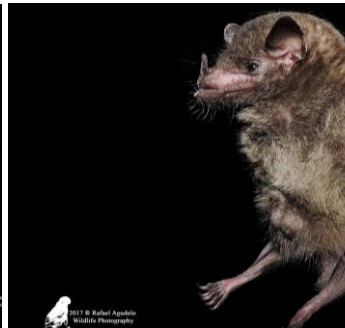
7 Anoura caudifer (Nectarívoro) Familia: Phyllostomidae