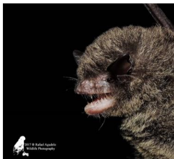
47 Eptesicus brasiliensis (Insectívoro) Familia: Vespertilionidae