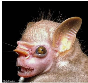
38 Sphaeronycteris toxophyllum Hembra (Frugívoro) Familia: Phyllostomidae