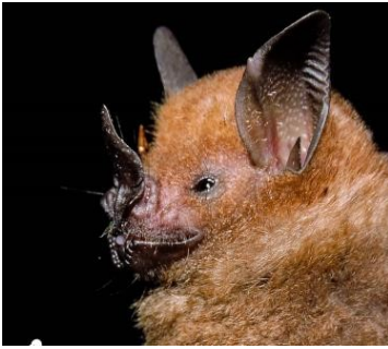
13 Carollia castanea (Frugívoro) Familia: Phyllostomidae