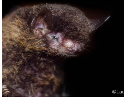
50 Myotis nigricans (Insectívoro) Familia: Vespertilionidae