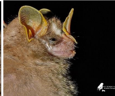
19 Dermanura gnoma . (Frugívoro) Familia: Phyllostomidae