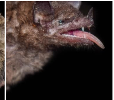
8 Anoura geoffroyi (Nectarívoro) Familia: Phyllostomidae