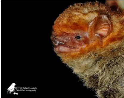
49 Lasiurus blossevillei (Insectívoro) Familia: Vespertilionidae