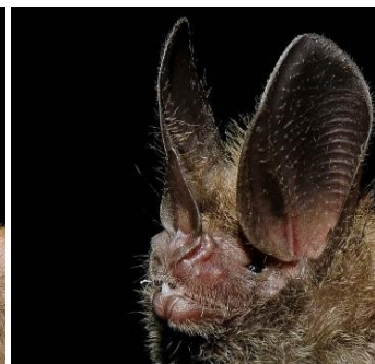
32 Micronycteris hirsuta (Insectívoro) Familia: Phyllostomidae