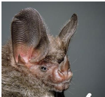
41 Tonatia saurophila (Insectívoro) Familia: Phyllostomidae