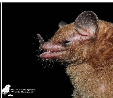
26 Lionycteris spurrelli (Nectarívoro) Familia: Phyllostomidae