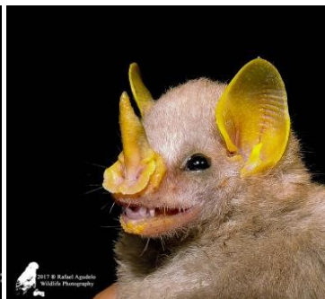
31 Mesophylla macconnelli (Frugívoro) Familia: Phyllostomidae