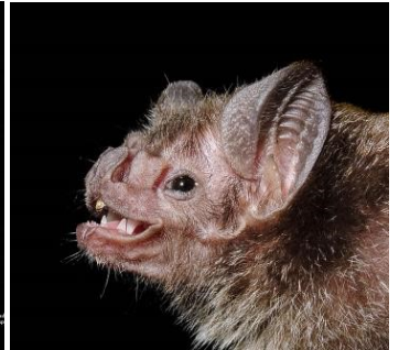
20 Desmodus rotundus (Hematófago) Familia: Phyllostomidae