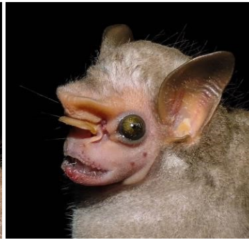
39 Sphaeronycteris toxophyllum Macho (Insectívoro) Familia: Phyllostomidae