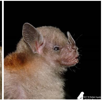
40 Sturnira lilium (Frugívoro) Familia: Phyllostomidae