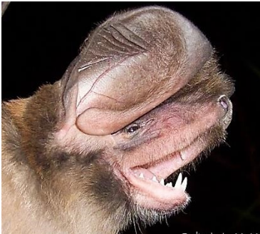
5 Eumops sp. (Insectívoro) Familia: Molossidae