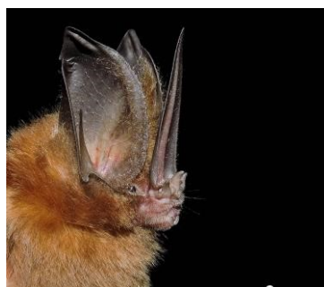
27 Lonchorhina aurita (Insectívoro) Familia: Phyllostomidae