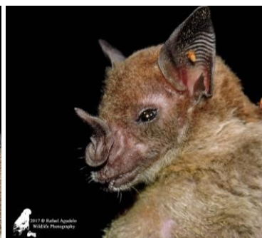
34 Phyllostomus discolor (Insectívoro) Familia: Phyllostomidae