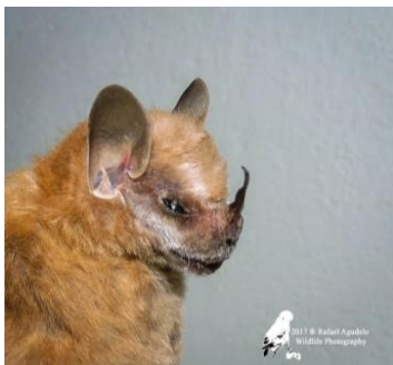
45 Vampyressa sp. (Frugívoro) Familia: Phyllostomidae