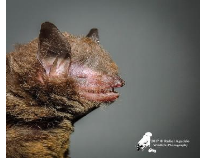
51 Myotis riparius (Insectívoro) Familia: Vespertilionidae