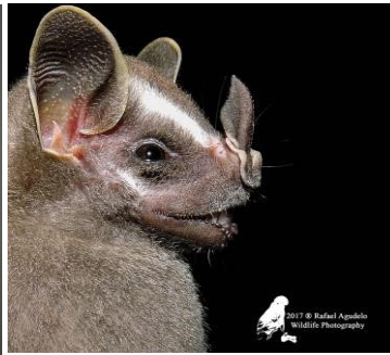
43 Uroderma bakeri (Frugívoro) Familia: Phyllostomidae