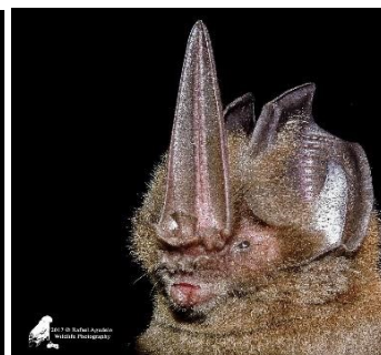
28 Lonchorhina mankoma (Insectívoro) Familia: Phyllostomidae