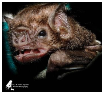
21 Diaemus youngi (Hematófago) Familia: Phyllostomidae