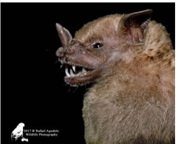
9 Artibeus lituratus (Frugívoro) Familia: Phyllostomidae