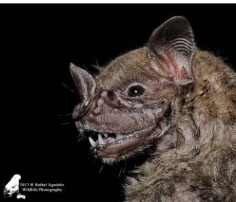
11 Artibeus planirostris (Frugívoro) Familia: Phyllostomidae