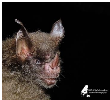
25 Glyphonycteris daviesi (Insectívoro) Familia: Phyllostomidae

[fieldguides.fieldmuseum.org] [1006] versión 1 5/2018