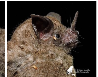
12 Carollia brevicauda (Frugívoro) Familia: Phyllostomidae