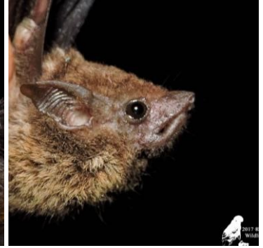
4 Saccopteryx leptura (Insectívoro) Familia: Emballonuridae