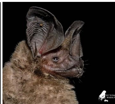
30 Lophostoma silvicolum (Insectívoro) Familia: Phyllostomidae