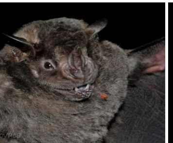
10 Artibeus obscurus (Frugívoro) Familia: Phyllostomidae