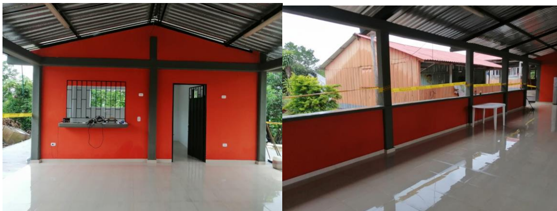
Adecuación restaurante escolar y construcción placa de tanques Sede Caracol I.E Triunfo II