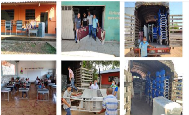
Imagen fotográfica de la entrega de mobiliario escolar en la institución educativa las acacias sede baja unión y en la sede educativa Panure sede principal.