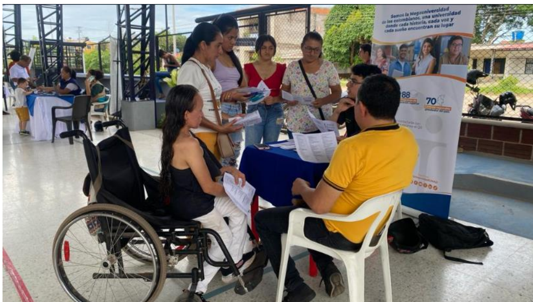
imagen de la feria educativa 2023.