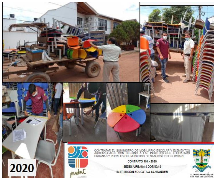
Imagen del mobiliario escolar entregado a la Institución Educativa Santander