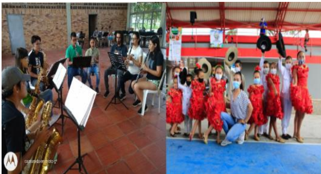
fotografias: Proceso de formación banda de vientos y danza llanera