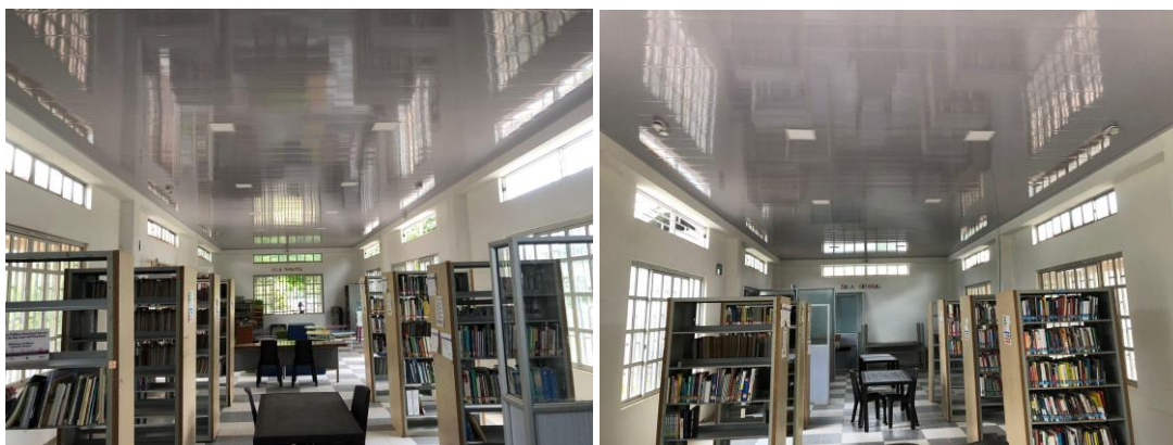
Imagen Biblioteca Pública Municipal - Instalación cielo raso