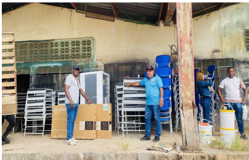
Imagen de entrega de dotación tecnológica realizada a la Institución Educativa José Miguel López Calle en el año 2022