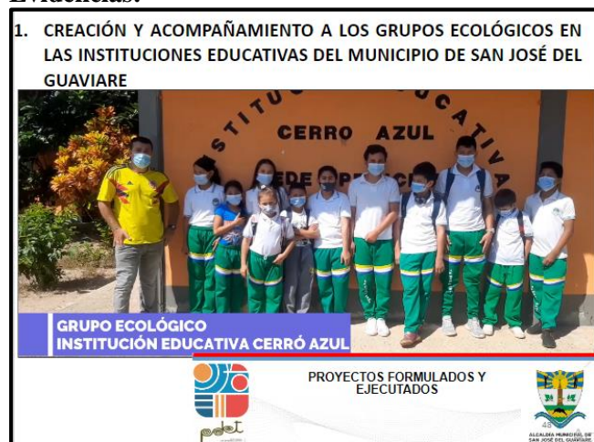
fotografía del grupo ecológico de la institución educativa cerro azul del municipio de san José del guaviare