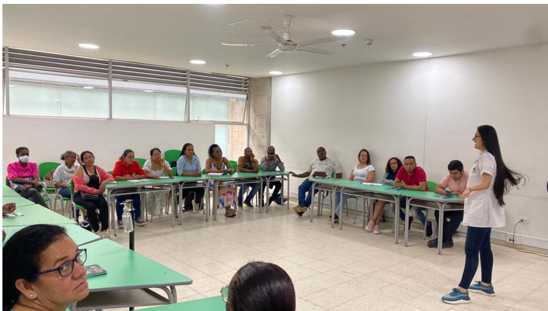
fotografía de la capacitación docente en fortalecimiento del inglés como lengua extranjera