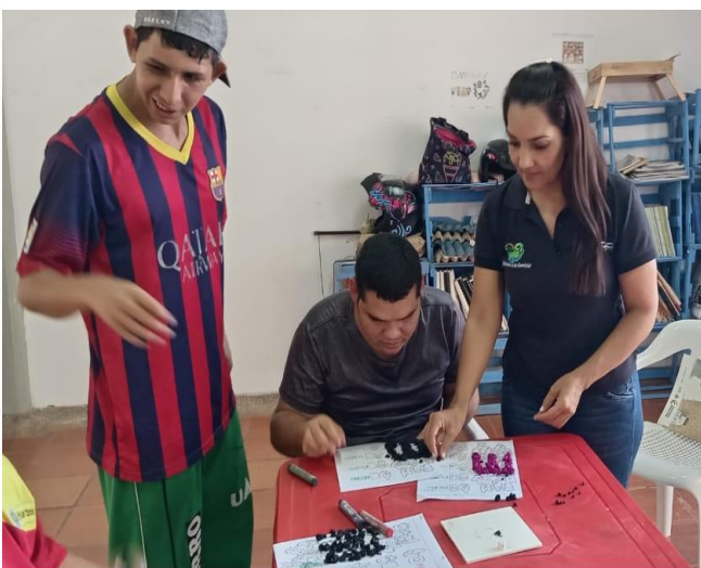
imagen oferta educativa para personas con necesidades educativas especiales y capacidades excepcionales - extensión Bibliotecaria y Casa Lúdica