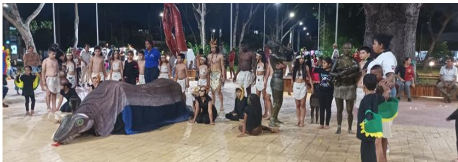
Imagen: Proceso danza folclórica y danza llanera (EFAC)