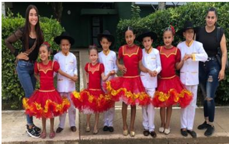
Imagen: Festival de colonias 2023