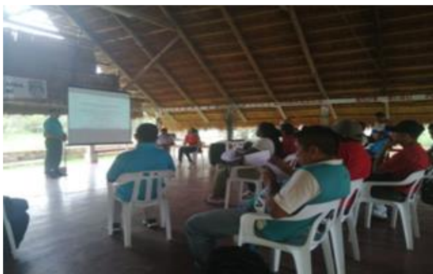
imagen capacitación en fortalecimiento e implementación de la Cátedra de Estudios Afrocolombianos.