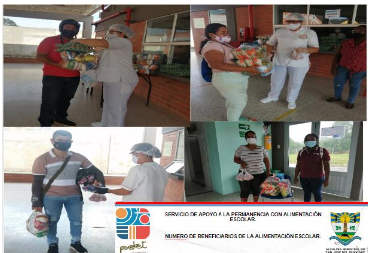
Imagen fotográfica de entregas de raciones alimentarias en Emergencia Sanitaria COVID 19