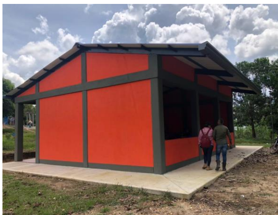
Imagen del aula construida en la Institución Educativa Triunfo II sede Caracol