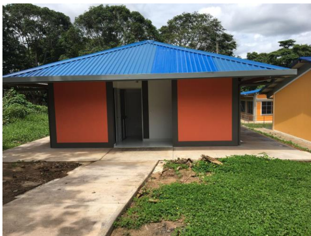
Imagen baterías sanitarias construidas en la sede principal de la I.E Jose Miguel Lopez Calle

Evidencia del cumplimiento de esta meta se llevó a cabo las siguientes actividades: