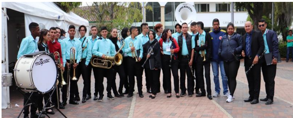
Imagen. Banda Municipal de vientos (EFAC)