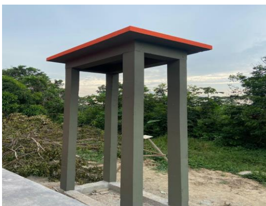
Adecuación restaurante escolar y construcción placa de tanques Sede Caracol I.E Triunfo II