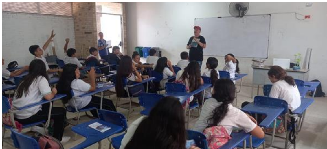
fotografía de la extensión bibliotecaria en el program de Lectura en voz alta