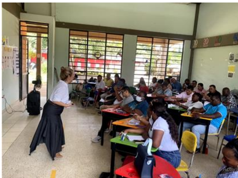
Imagen capacitación denominada “Metodología Escuela Nueva y Liderazgo Administrativo