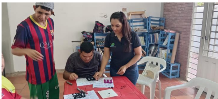
fotografía del programa de extensión bibliotecaria con población con enfoque diferencial