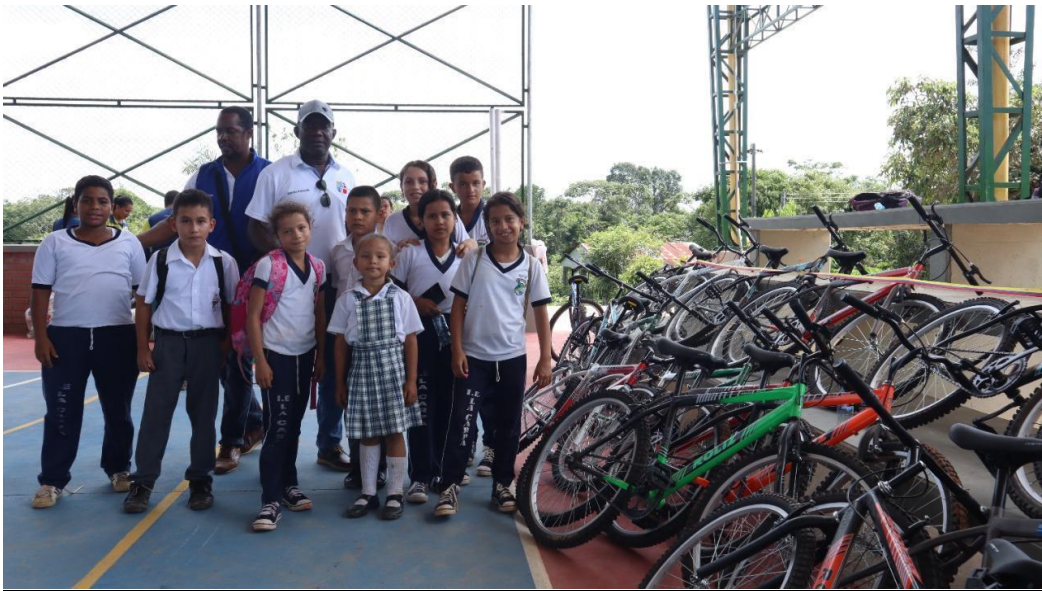
imagen de la entrega de bicicletas en la institución educativa José Miguel López Calle del municipio de San José del Guaviare