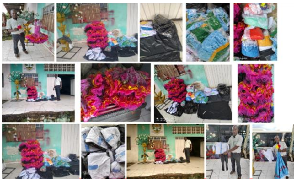
Dotaciones realizadas procesos de formación de la escuela (EFAC) 2021