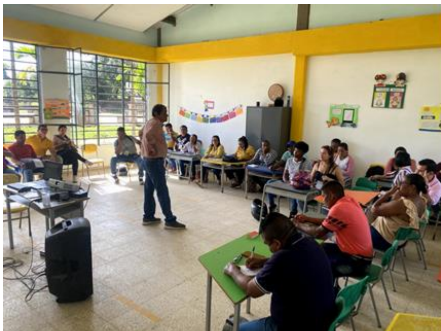
Imagen capacitación denominada “Metodología Escuela Nueva y Liderazgo Administrativo