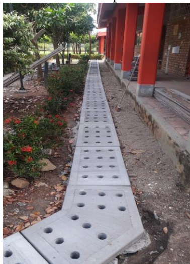
Imagen construcción canal de aguas lluvias sede principal I.E El Retiro

Evidencia del cumplimiento de esta meta se llevó a cabo las siguientes actividades: