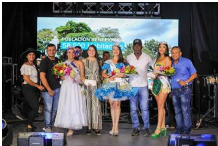
Fotografía del festival de colonias 2023.