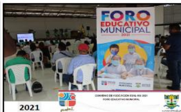
imagen foro educativo 2020 y 2021 realizado en la Emergencia Sanitaria -COVID 19