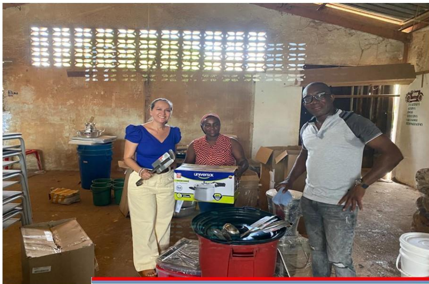
Imagen fotográfica de la entrega de menajes realizada a la Institucion Educativa Concentracion De Desarrollo Rural CDR